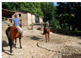
Partenza per l'escursione

Per esperti e principianti. Trekking sui sentieri delle montagne di Michelangelo. Fino a Massa e alle cave di marmo